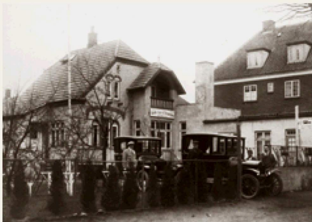
Søborg Hovedgade 77 før ombygningerne 1920-23.