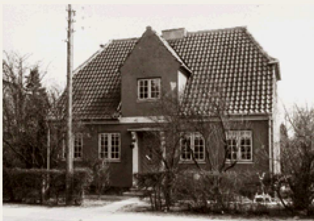
Mønsterhuset på Runebergs Allé 41 vises her på et gammelt billede, så man kan se, hvordan det oprindeligt er tænkt.

Mønsterhuset omtaltes af journalisten som intet mindre end et "eventyrslot"! "Slottet" rummede køkken med noget