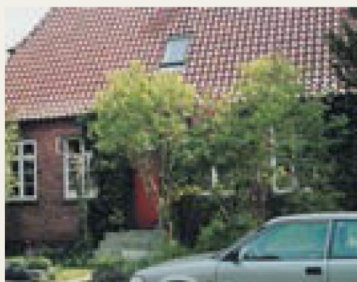
Runebergs Allé 7

Forskønnelsesforeningen og især arkitekterne Gothenborg, Meulengracht, Seest og Ahlén gjorde vitterligt deres bedste for at tegne mange og forskelligartede huse til folk. Går man ad Runebergs Alle, kan man få en enestående lejlighed til at se, hvad arkitekt K.T. Seest, som jo havde en mening om "Det runde Hus", mente med godt byggeri idet han mellem 1912 og 1922 tegnede følgende af vejens huse: 41, 39, 35-37, 15, 12, 11, 7 og 3! Umiddelbart ligner villaerne ikke hinanden, men prøv alligevel at kigge nøjere efter: