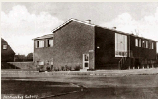
Det splinternye hovedbibliotek på et postkort anno 1940.

På Gladsaxevej 111 ligger endnu et af arkitekt Vilhelm Lauritzens huse. Det rummede en periode kommunens samling af afrikansk kunst, men det blev bygget allerede i 1939-40 for at huse kommunens hovedbibliotek. Ideen var, at man ville bygge et fuldstændig identisk hus i Bagsværd, ligeledes til bibliotek, men p.g.a. krigen blev planerne udskudt og sidenhen skrinlagt. Da Høje Gladsaxe Centret stod klar til indflytning (selvom det ikke var 100% færdigbygget endnu), rykkede hovedbiblioteket derover. Det var i 1966. I stedet fik kunst- og musikafdelingen til huse på Gladsaxevej 111. Først i 1979 kunne man samle hovedbiblioteket under det nuværende tag på Søborg Hovedgade 220. I dag ejes huset af druideordenen.