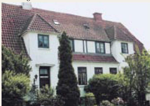
Runebergs Allé 35-37