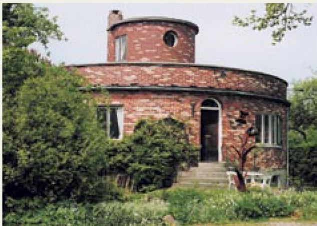
Det runde hus, 2005.