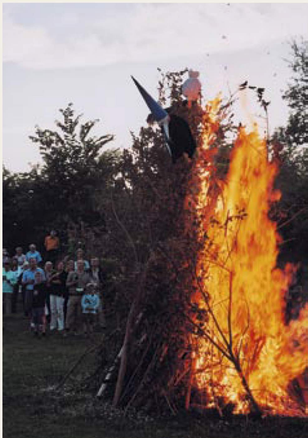
Garhøj bruges stadig til Skt. Hans fester. Disse to fotos er, ligesom forsidebilledet, taget 23/6-2005.

de forlangt. Socialdemokraterne brugte parken til deres grundlovsfester, Søborg Idrætsforening lavede søborgrevyer og holdt pinsefester i parken, og Garhøjkomiteen selv lavede hvert år en gigantisk Skt. Hans fest med bål, taler, border, gynger, karrusel og restauration for at skaffe yderligere penge til at udvikle og vedligeholde Garhøj og den omliggende park.