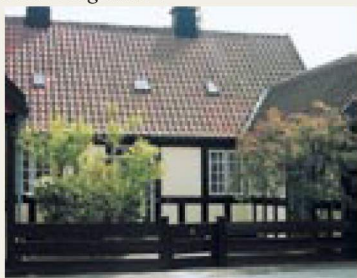
Runebergs Allé 11