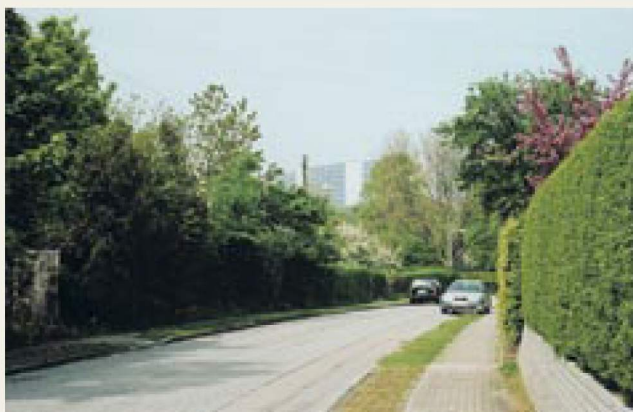
Høje Gladsaxe set fra Nordtoftevej, 2005.

Går man et stykke videre ad Daltoftevej, kan man dreje til venstre ad Nordtoftevej, og på den led komme til Holmevej, hvor Garhøj ligger. Standser man ca. midt i opstigningen på Nordtoftevej og vender sig om, har man en flot udsigt til Høje Gladsaxe.