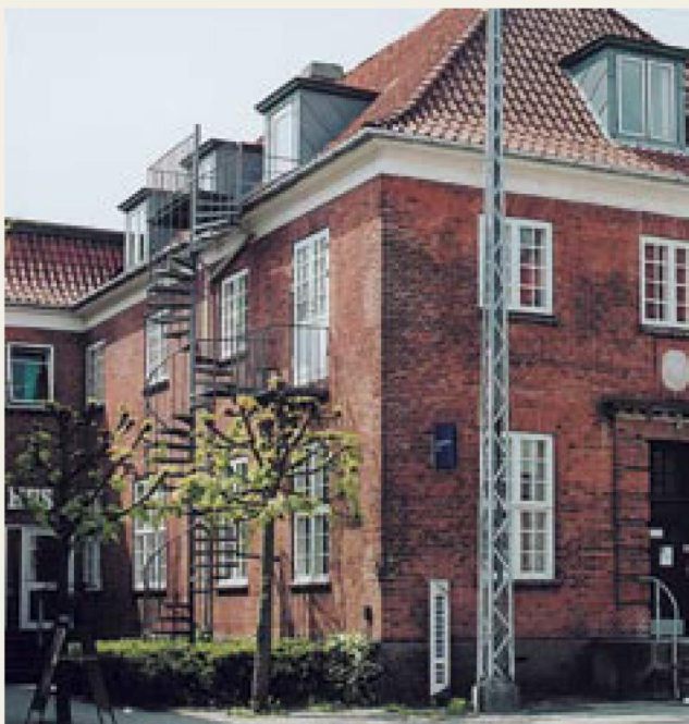
Bagbygningen, som i 1939 kun blev ført op til og med stueetagen og afsluttet med postmesterens private terrasse, ses her bag til venstre.

I 1939 var posthuset allerede blevet for småt, og ikke mindst savnede personalet flere toiletter samt en frokoststue. Det klarede man ved at lave den tilbygning, som man stadig kan se på posthusets bagside ved Wergelands Allé samt fra Søborg Hovedgade, idet tilbygningen på tværs gjorde, at man fik den lille gårdsplads, som stadig er der. I første omgang byggede man kun tilbygningen op til og med stueplan. Man afsluttede med en lav mur, så postmesteren fik udgang til en stor terrasse fra sit herreværelse.