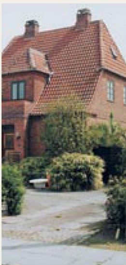
Runebergs Allé 15