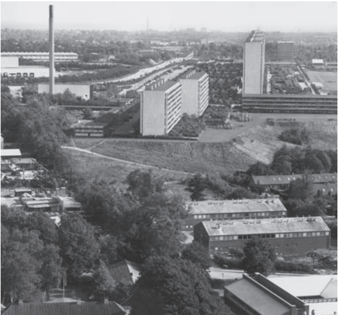
Foto taget fra gastårnet i Mørkhøj i retning mod Høje Gladsaxe og Gladsaxe Industriquarter.

I 2. verdenskrigs første år opfordrede regeringen unge mennesker til at tage ar-