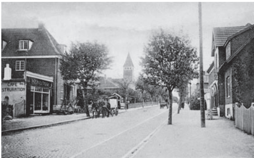
Søborg omkring 1915. Hovedgaden var efterhånden rimeligt bebygget, men bevægede man sig ud i Søborghus Villakvarter nær Vangederenden, så var det stadig meget landligt, som man vil kunne se på et billede senere i dette hæfte.

Men nybyggerne fra København havde pionerånd, og snart slog et utal af håndværkere sig ned i kommunen, så de kunne tjene på opbygningen af den nye bydel. I kommunens vejviser fra 1912 kan man få et indtryk af mængden af håndværkere i kommunen. Der var: 2 arkitekter; 2 blikkenslagere; 1 cigarfabrikant; 2 entreprenører; 3 glarmestre; 1 gørtler; 2 kurvemagere; 8 malermestre; 17 murermestre; 2 sadelmagermestre; 5 skomagere; 4 skræddermestre; 6 smedemestre; 10 tømmere; 1 urmager og 3 vandmestre.