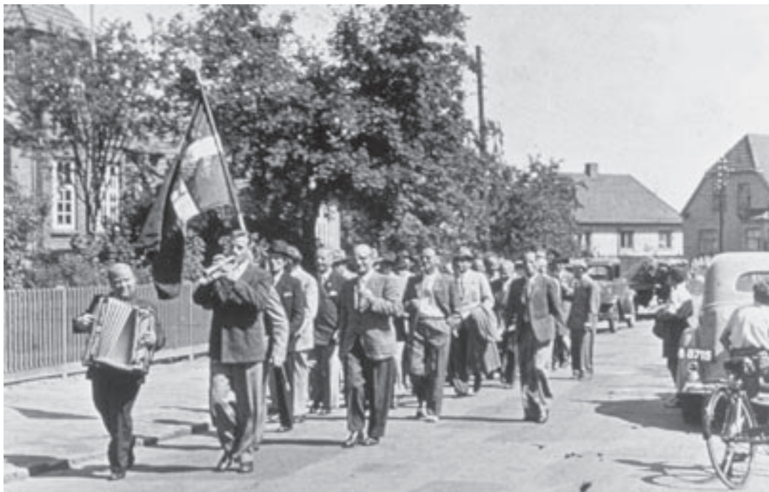
Gladsaxe Håndværkerforening på march ned ad Erik Bøghs Alle.

hast i 1800-tallet, hvor de mange nye maskiner overfløddiggjorde en stor del af arbejdskraften i landbruget, men hvor der til gengæld kunne bruges uendelige mængder mænd, kvinder og børn på landets fabrikker, der som oftest var centrerede omkring byerne. I tusindvis kom de til byerne, og industriens idealer: Fremskridt, vækst, præcision og organisation kom til at præge store dele af samfundet.