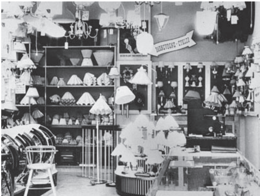
Kig i Bristols forretning 1953.

gen Bristol d. 1/3-1938. Han var udlært maskinarbejder, men havde mange års erfaring i cykelbranchen som bestyrer af sin ældre brors cykelforretning, som hed Stjerneborg, og som den dag i dag stadig ligger på Amagerbrogade 163.