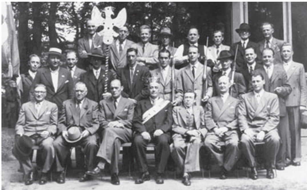
Bagsværd Håndværkerforenings fugleskydning august 1948.

med både spisning og dans. Fra 1916 afholdt Gladsaxe Håndværkerforening desuden bankospil til fordel for foreningens daværende drømmemål: Gladsaxe Tekniske Skole, som man allerede i 1917 delvist kunne realisere, nemlig ved at leje lokaler på Søborg Skole til den tekniske undervisning. I 1924 stod den første tekniske skole i Gladsaxe færdig på Søborg Hovedgade 122.