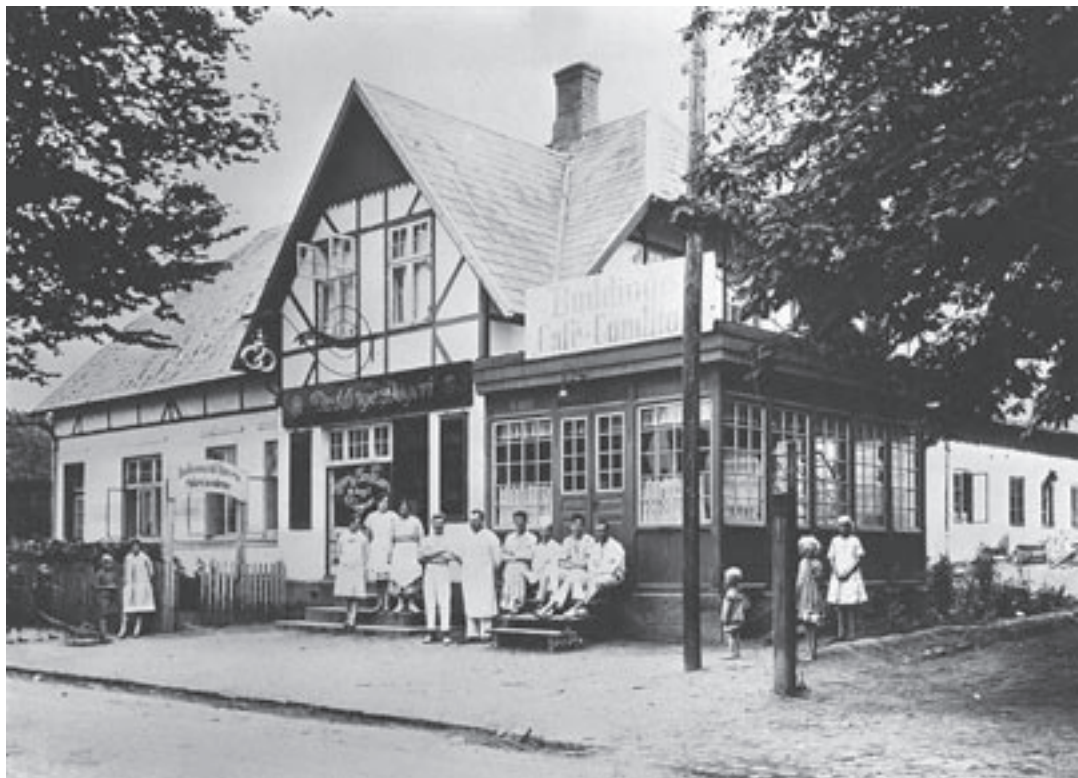
Buddinge Bageri, Buddinge Hovedgade 31, i 1927.

blev primært organiseret i HK, som startede i 1900 med blot 700 medlemmer. I 1936 var tallet vokset til 25.000 medlemmer. Pr. 1/1-2003 var der 375.140 medlemmer.