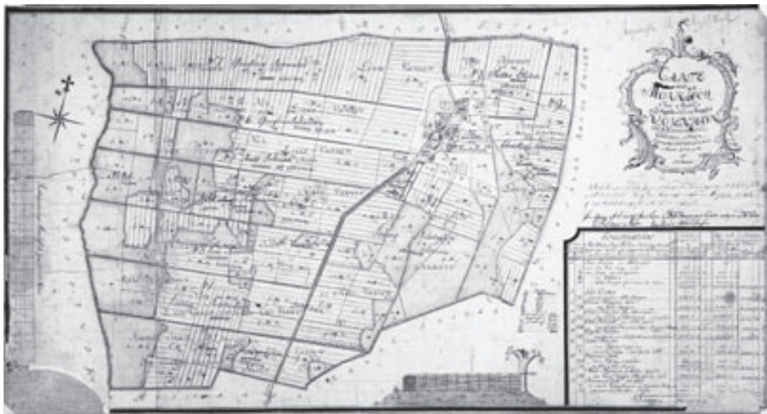
Udskiftningskort fra Mørkhøj by 1771. Kortet viser hvordan landsbyens jorder blev udskiftet til de enkelte gårdes jorder.