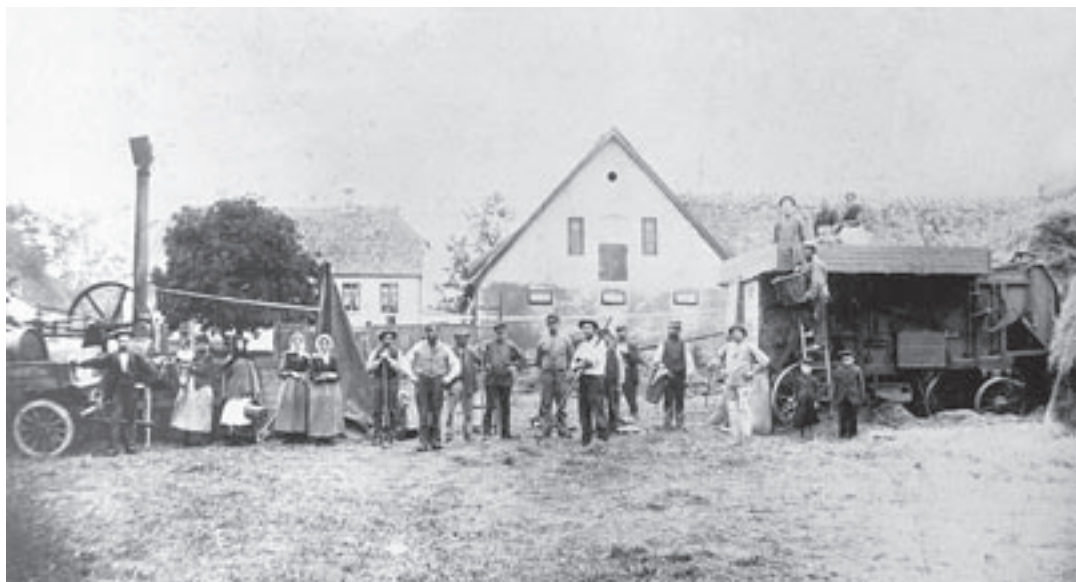
Landarbejdere i gang med tærskning på Kongsvillie omkring 1892.