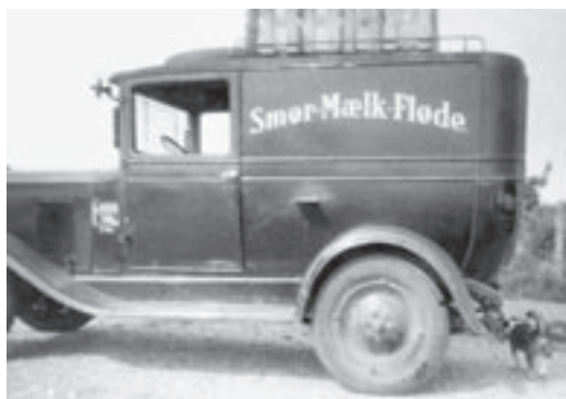
Mælkebil ca. 1910.

derne købte kælvkøer, der malkede, så længe det lod sig gøre og derpå blev solgt til slagting.