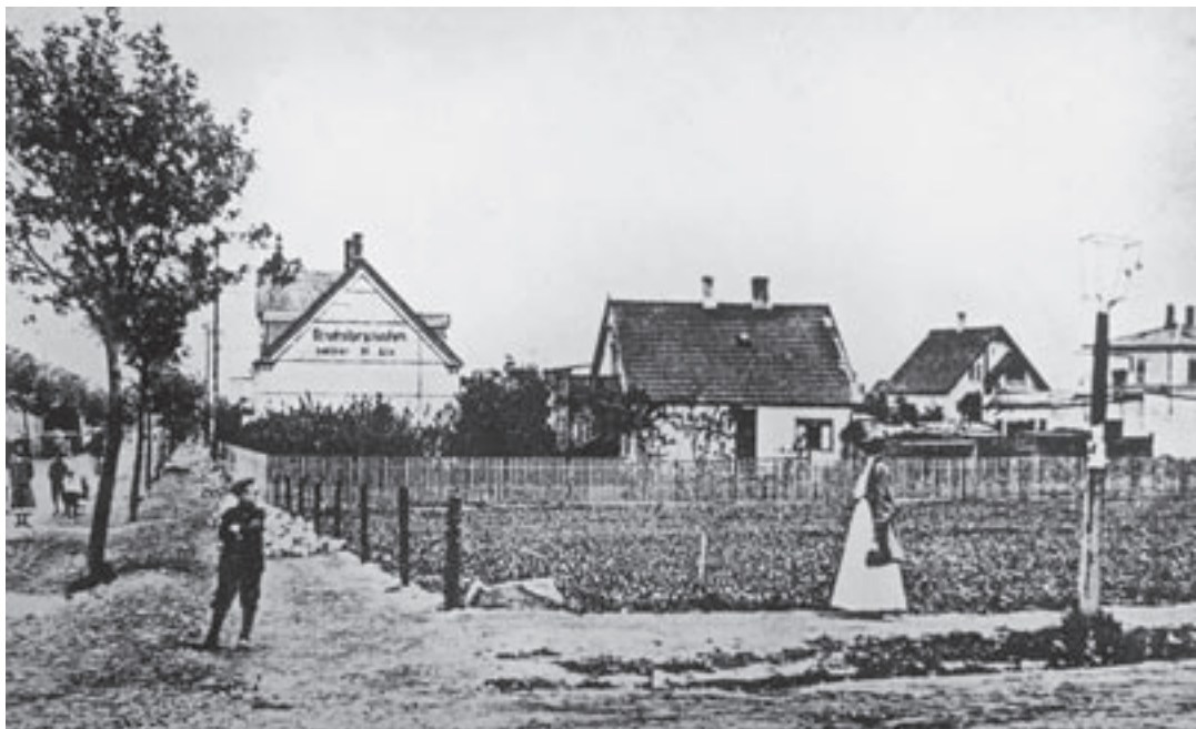
Dette foto fra ca. 1905 viser, at befolkningen i Søborg var vokset så meget, at den første brugsforening kunne åbnes ved hjørnet af Selma Lagerløfs Alle.

Befolkningstallet i hele kommunen i 1912 var 4417, heraf boede mere end 2000 i Søborg.