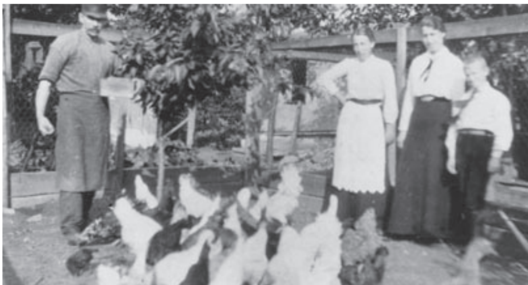
Høsehuse lå på Marienborg Alle. Det var kvindernes opgave at passe de mindre dyr. Her ses to kvinder i gang med at samle æg.

Til kvindernes daglige gøremål hørte det, at sørge for madlavningen, rengøringen samt at fodre mindre dyr. De passende yderligere familiens små, gamle og syge medlemmer. Andre af kvindernes arbejdsopgaver skulle gøres flere gange i løbet af et år, som for eksempel bagning, ølbrygning og tøjvask. I 1800 tallet brug-