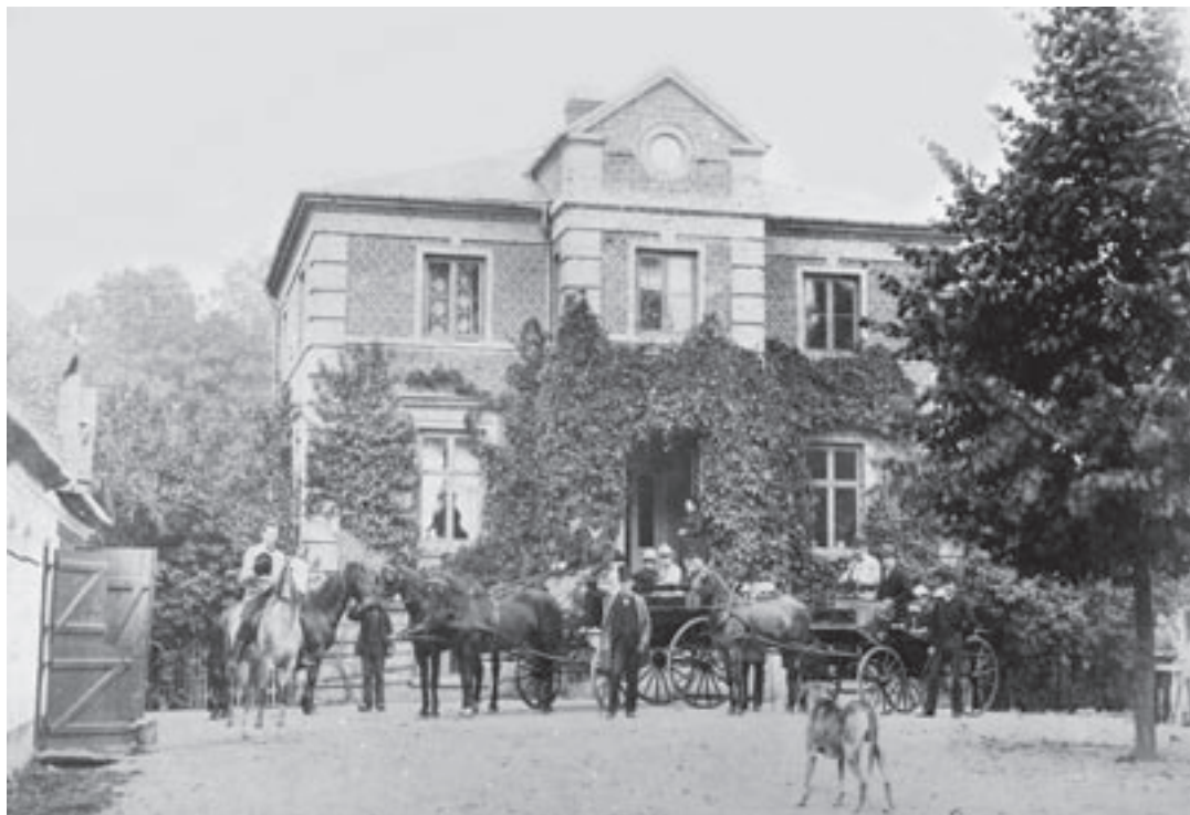
Stengårdens hovedbygning ca. år 1900. Hovedbygningen stammer så vidt vides fra slutningen af 1700-tallet.

Kongen gik derfor ind og finansierede forsøg med dansk fåreavl, og det kom til at foregå på Stengård – eller Lynggård, som den hed dengang. Man startede med en bestand på ca. 100 får, men forsøget blev aldrig nogen succes, og efter nogle år blev fårene flyttet til en anden forsøgsfarm ved Esrom, hvor græsningsforholdene var bedre.