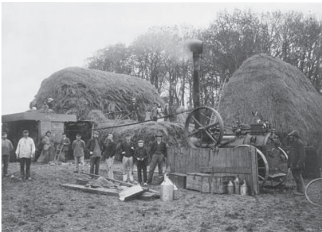
Høstarbejder på Mørkhøjgård 1907. I høstsæsonen hjalp kvinderne til i marken, for her var der brug for alt den hjælp man kunne få.

tes askelud som vaskemiddel ved linnedvask. Askelud blev lavet af vand og aske, helst af bøgeaske. Vasketøjet blev lagt i et kar med askebleen, et groft stykke lærred, som blev lagt over. Ovenpå kom bøgeaske og kogende vand. Efter iblødsætningen blev vasketøjet lagt på en stol. Skidt og vaskemiddel blev banket ud af tøjet med en banketærskel.