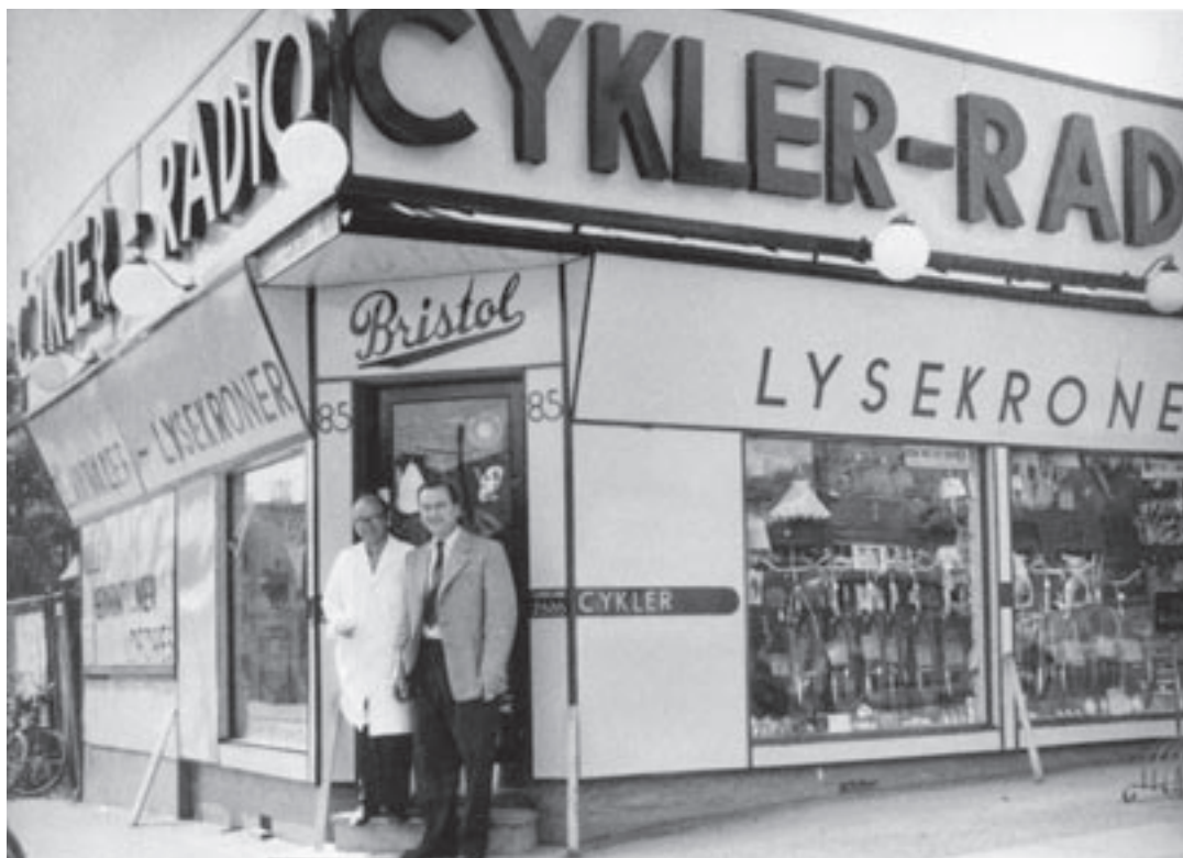
Bristol i bindingsværksbygningen. Der blev bygget en pæn, tidssvarende facade. Billedet er fra indvielsesdagen 1/3-1938.

WC udenfor på trappen og soveværelset på 1. sal! I 1927 blev forretningen udvidet til det dobbelte og et kontor blev indrettet i køkkenet, så nu boede vi selv i hele huset, det var en dejlig forandring”.