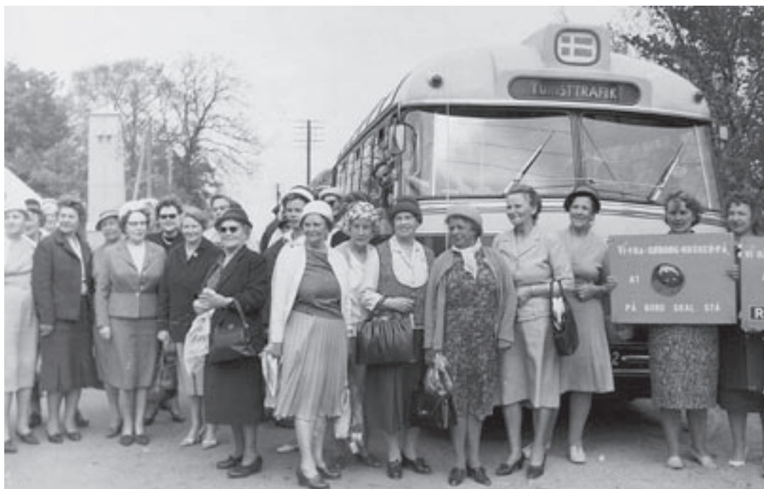
Søborg og omegns Husmoderforening på udflugt i 1950.