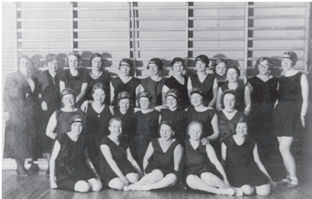
Gymnastikhold fra Bagsværd Kvindelig Gymnastikforening.

holdningen var at gifte kvinders plads fortsat skulle være i hjemmet. Til gengæld ønskede man at få det private husarbejde anerkendt som erhverv på lige fod med mandens. Ægteskabsloven fra 1925 ligestillede parterne i ægteskabet. Hermed var den formelle ligestilling opnået.