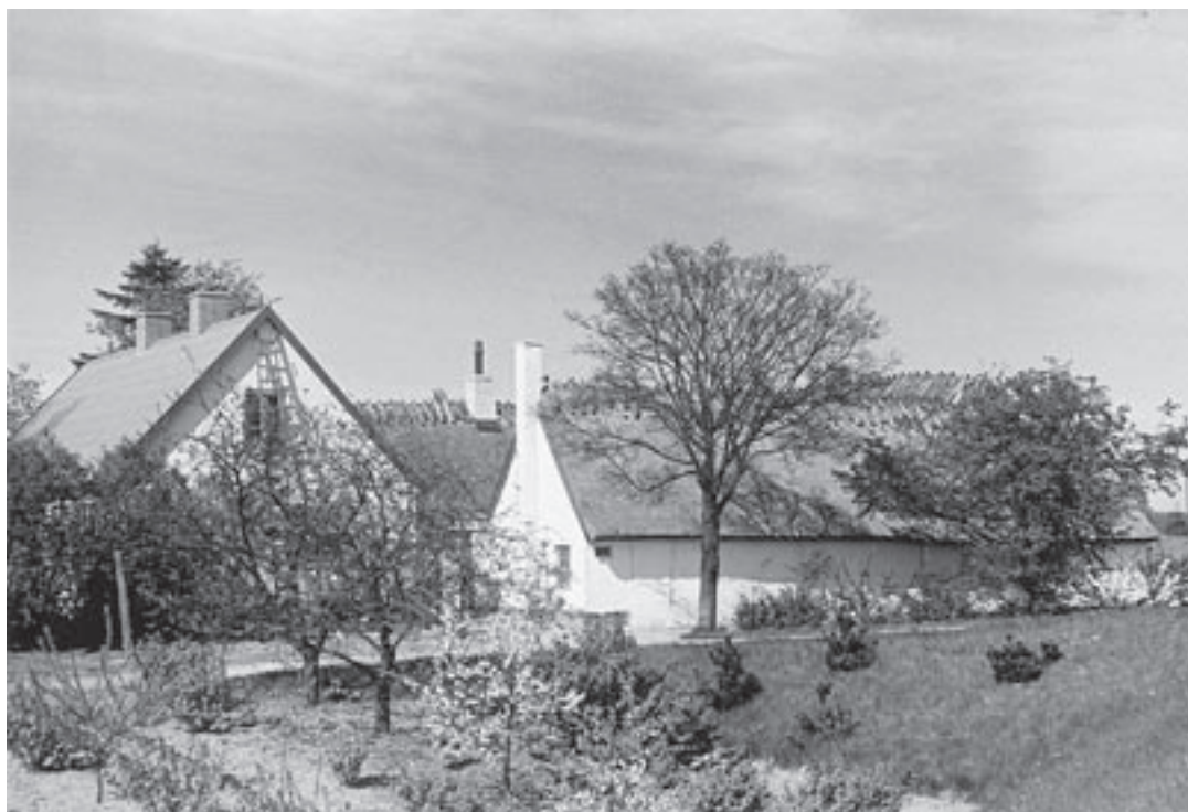
Her ses Simonsens gård i Bagsværd. Det var her mælkeepidemien startede. Ca. 1950.

lægningen og andelsbevægelsen ændret landbrugssamfundet. Bonden var blevet gårdejer: Politisk var han venstremand. Andelsmejeriet aftog hans mælk, slagteriet hans svin. Smør og bacon blev eksporteret. Indtægterne steg og kunne omsættes i nogle af de nye maskiner eller investeres i opførelsen af en moderne gård, der svarede til den ændre drift. I Gladsaxe gik udviklingen i en anden retning. Her havde man satset på vekselbrug og levering til København. Dette medførte at man her i kommunen ikke mærkede den samme fremgang i landbruget. Derimod blev nogle gårde i Gladsaxe Kommune udstykket til bl.a. byggegrunde og gartne-