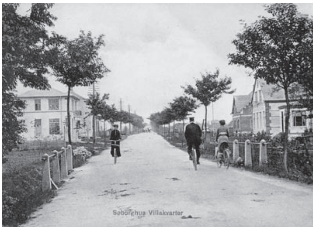
Gadebillede fra området omkring Søborg Hovedgade/Søborghus Alle/Vangederenden. Mange af de pæne haver dækkede over mere eller mindre officielle små virksomheder.

I 1983 blev den lille sportsforretning flyttet til større lokaler i en tidligere radioforretning på Søborg Hovedgade 104.